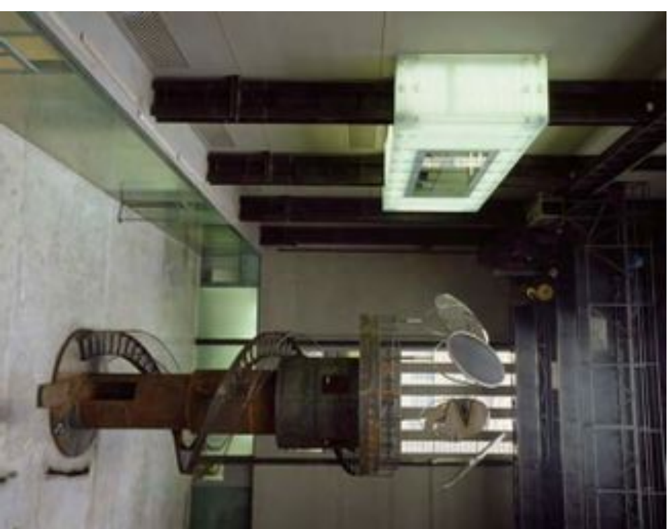
L. Bourgeois / do, I undo and I redo (Tate Modern Londen 2000)

van de moeder en de maîtresse; de conflicterende emoties van haat en liefde; het geheim en de onthulling; het web van stille verwijten en fluisterend uitgesproken beschuldigingen; het verlies van de onschuld en de warmte van het moederschap.