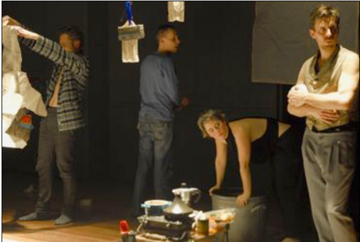
de woorden de dingen