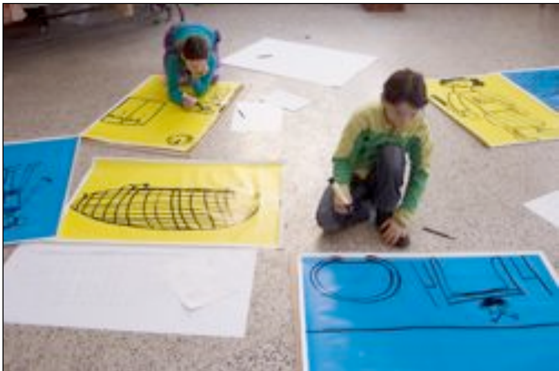
Op/Af in De Snijzaal