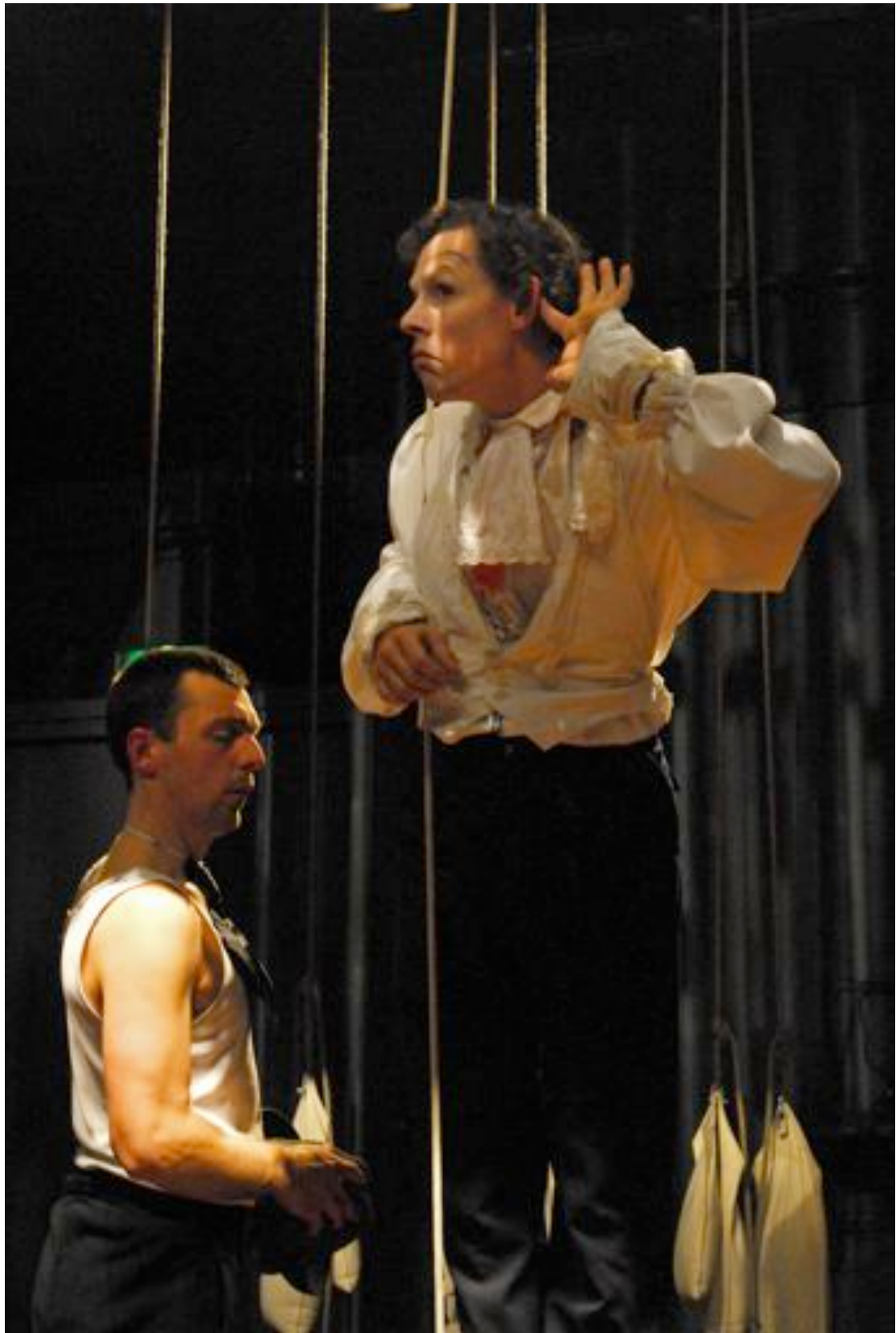
I think we're in Rats' Alley