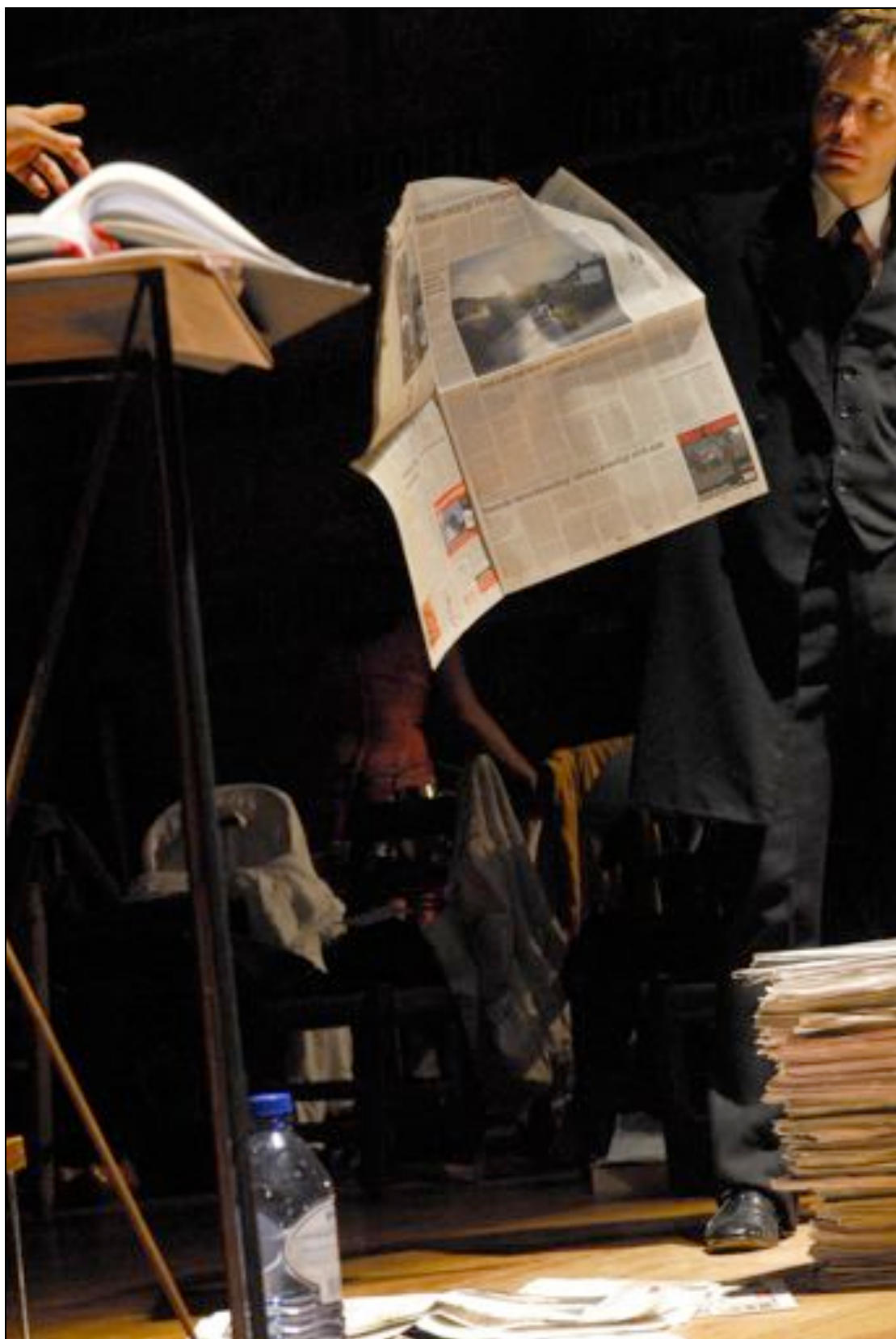
De laatste dagen der mensheid