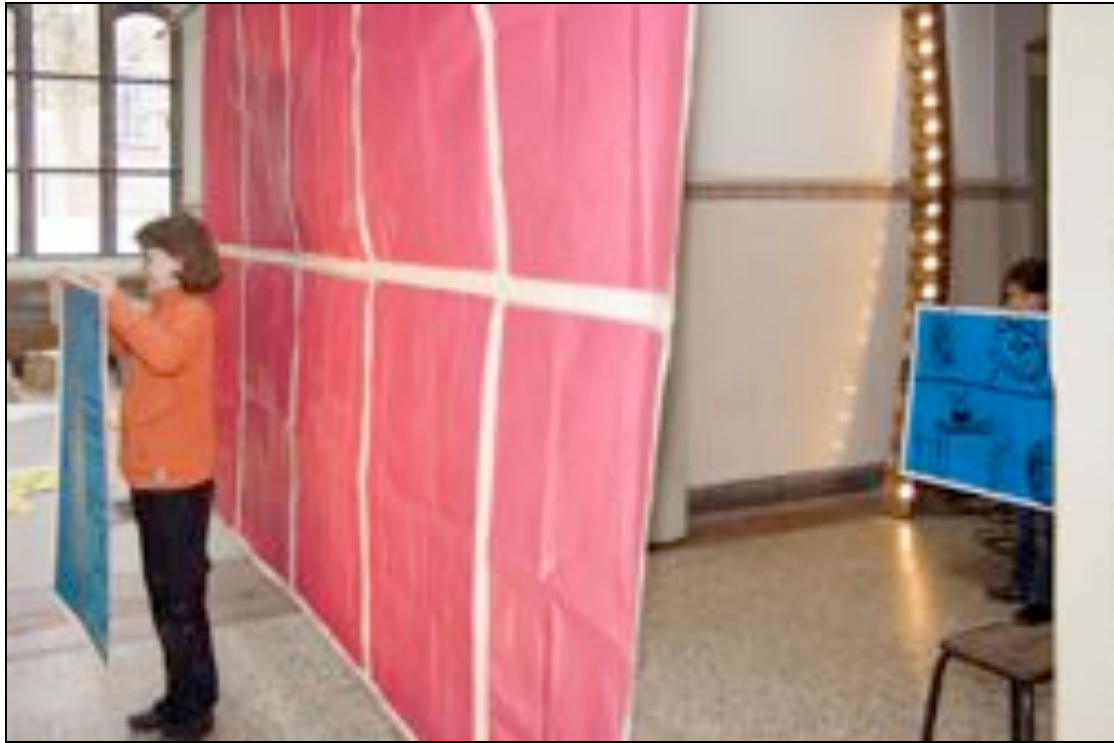
Op/Af in De Snijzaal