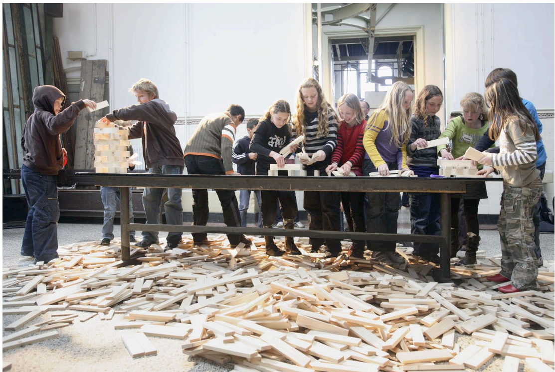
't Barre Land speelt Neushoorn