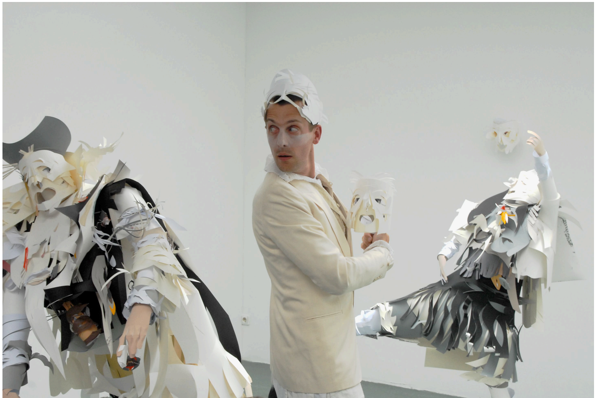
't Barre Land speelt Wooff! Wooff! Or Who killed Richard Wagner?